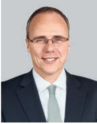
Peter Beuth Hessischer Minister des Innern und für Sport

Sehr geehrte Damen und Herren, sehr geehrtes Organisationsteam, liebe Besucher des Intersec Forums,